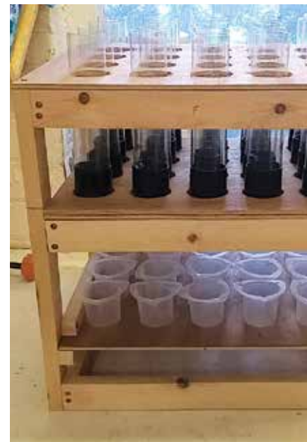
Montaje de las columnas de suelo

La figura muestra las características de liberación prolongada del Polisulfato. El 100% de los iones sulfato provenientes del sulfato de amonio fueron liberados y recuperados en el lixiviado en los primeros seis días, mientras que aquellos del sulfato de potasio y la kieserita tardaron 12 y 21 días respectivamente. En comparación con estos tres fertilizantes, todos los iones sulfato del Polisulfato fueron liberados en la capa superficial del suelo y tardaron alrededor de 50 días para ser lixiviados, lo cual asegura una mayor absorción por los cultivos.